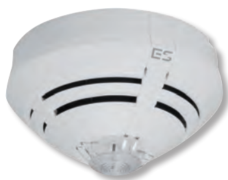
Nouvelle génération de détecteurs conventionnels ES Detect

Simple, rapide à mettre en oeuvre et offrant un excellent rapport qualité/prix, l'ECS/CMSI ES Line est LA solution idéale pour un grand nombre de bâtiments : hôtels, restaurants, écoles, magasins, bureaux, etc. Cette nouvelle gamme d'ECS ESSER by Honeywell a été conçue et développée en association avec la nouvelle génération des détecteurs conventionnels ES Detect.